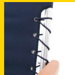
BACK AND SEAT WITH ELASTIC CORD