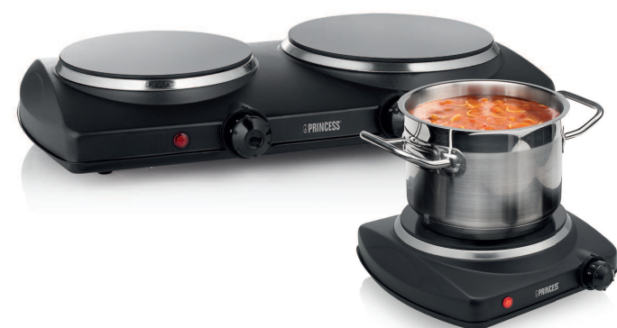
Ceramic Hot Plate Double Ceramic Hot Plate 01.303020.01.001 / 01.303021.01.001

PARTS DESCRIPTION / ONDERDELENBESCHRIJVING / DESCRIPTION DES PIÈCES / TEILEBESCHREIBUNG / DESCRIPCIÓN DE LAS PIEZAS / DESCRIÇÃO DOS COMPONENTES / DESCRIZIONE DELLE PARTI / BESKRIVNING AV DELAR / OPIS CZĘŚCI / POPIS SOUČÁSTÍ / POPIS SUČASTI / ОПИСАНИЕ ЗАПЧАСТИ