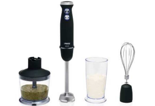
Hand blender set 01.221220.01.001

PARTS DESCRIPTION / ONDERDELENBESCHRIJVING / DESCRIPTION DES PIÉCES / TEILEBESCHREIBUNG / DESCRIPCIÓN DE LAS PIEZAS / DESCRIÇÃO DOS COMPONENTES / DESCRIZIONE DELLE PARTI / BESKRIVNING AV DELAR / OPIS CZĘŚCI / POPIS SOUČÁSTÍ / POPIS SOUČASTI