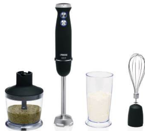
Hand blender set 01.221220.01.001

PARTS DESCRIPTION / ONDERDELENBESCHRIJVING / DESCRIPTION DES PIÈCES / TEILEBESCHREIBUNG / DESCRIPCIÓN DE LAS PIEZAS / DESCRICÃO DOS COMPONENTES / DESCRIZIONE DELLE PARTI / BESKRIVNING AV DELAR / OPIS CZĘŚCI / POPIS SOUČÁSTÍ / POPIS SOUČASTI