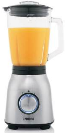
Blender Stainless Steel 1000 01.212091.01.001

PARTS DESCRIPTION / ONDERDELENBESCHRIJVING / DESCRIPTION DES PIÉCES / TEILBESCHREIBUNG / DESCRIPCIÓN DE LAS PIEZAS / DESCRIÇÃO DOS COMPONENTES / DESCRIZIONE DELLE PARTI / BESKRIVNING AV DELAR / OPIS CZĘŚCI / POPIS SOUČÁSTÍ / POPIS SUČASTI / ОПИСАНИЕ ЗАПЧАСТІ