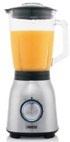
Blender Stainless Steel 1000 01.212091.01.001

PARTS DESCRIPTION / ONDERDELENBESCHRIJVING / DESCRIPTION DES PIÈCES / TEILEBESCHREIBUNG / DESCRIPCIÓN DE LAS PIEZAS / DESCRIÇÃO DOS COMPONENTES / DESCRIZIONE DELLE PARTI / BESKRIVNING AV DELAR / OPIS CZĘŚCI / POPIS SOUČÁSTI / POPIS SUČASTI / ОПИСАНИЕ ЗАПЧАСТИ