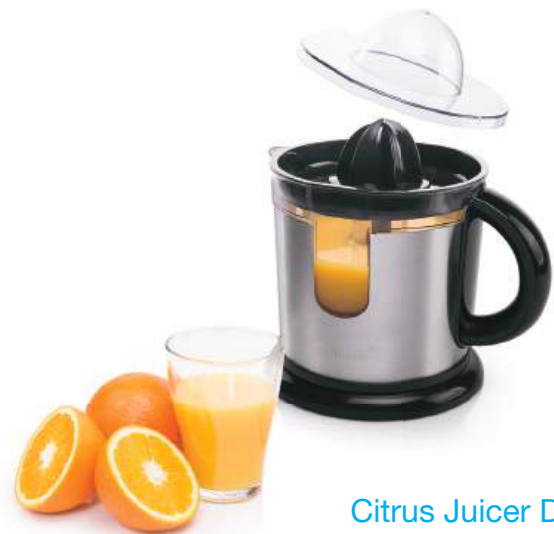
Citrus Juicer Duo 01.201975.01.001

PARTS DESCRIPTION / ONDERDELENBESCHRIJVING / DESCRIPTION DES PIÈCES / TEILEBESCHREIBUNG / DESCRIPCIÓN DE LAS PIEZAS / DESCRIÇÃO DOS COMPONENTES / DESCRIZIONE DELLE PARTI / BESKRIVNING AV DELAR / OPIS CZĘŚCI / POPIS SOUČÁSTÍ / POPIS SOUČASTÍ / ОПИСАНИЕ ЗАПЧАСТІ