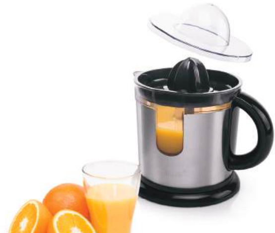
Citrus Juicer Duo 01.201975.01.001

PARTS DESCRIPTION / ONDERDELENBESCHRIJVING / DESCRIPTION DES PIÈCES / TEILEBESCHREIBUNG / DESCRIPCIÓN DE LAS PIEZAS / DESCRIÇÃO DOS COMPONENTES / DESCRIZIONE DELLE PARTI / BESKRIVNING AV DELAR / OPIS CZĘŚCI / POPIS SOUČÁSTÍ / POPIS SOUČASTI / ОПИСАНИЕ ЗАПЧАСТІ