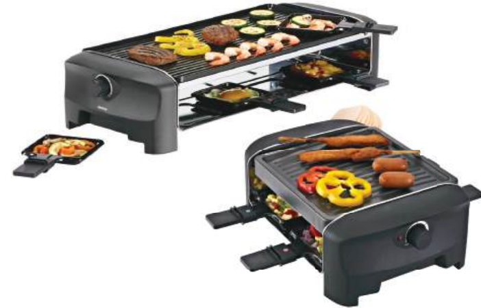
Raclette 4 Grill Party / Raclette 8 Grill and Teppanyaki Party 01.162800.01.001 / 01.162840.01.001

PARTS DESCRIPTION / ONDERDELENBESCHRIJVING / DESCRIPTION DES PIÈCES / TEILEBESCHREIBUNG / DESCRIPCIÓN DE LAS PIEZAS / DESCRICÃO DOS COMPONENTES / DESCRIZIONE DELLE PARTI / BESKRIVNING AV DELAR / OPIS CZĘŚCI / POPIS SOUČÁSTÍ / POPIS SÚČASTÍ / PARÇALARIN AÇIKLAMASI