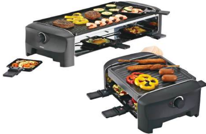
Raclette 4 Grill Party / Raclette 8 Grill and Teppanyaki Party 01.162800.01.001 / 01.162840.01.001

PARTS DESCRIPTION / ONDERDELENBESCHRIJVING / DESCRIPTION DES PIÈCES / TEILEBESCHREIBUNG / DESCRIPCIÓN DE LAS PIEZAS / DESCRIÇÃO DOS COMPONENTES / DESCRIZIONE DELLE PARTI / BESKRIVNING AV DELAR / OPIS CZĘŚCI / POPIS SOUČÁSTÍ / POPIS SOUČASTI / PARÇALARIN AÇIKLAMASI