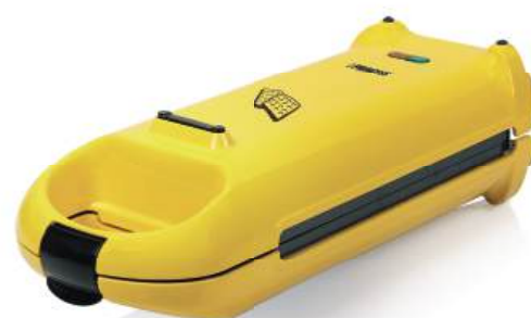
Waffle Maker Flip 01.132406.01.001

PARTS DESCRIPTION / ONDERDELENBESCHRIJVING / DESCRIPTION DES PIÈCES / TEILEBESCHREIBUNG / DESCRIPCIÓN DE LAS PIEZAS / DESCRIÇÃO DOS COMPONENTES / DESCRIZIONE DELLE PARTI / BESKRIVNING AV DELAR / OPIS CZĘŚCI / POPIS SOUČÁSTÍ / POPIS SUČASTI