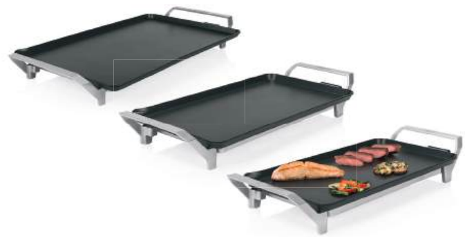
Table Chef Premium Table Chef Premium XL | Table Chef Premium XXL 01.103100.01.001 | 01.103110.01.001 | 01.103120.01.001

PARTS DESCRIPTION / ONDERDELENBESCHRIJVING / DESCRIPTION DES PIÈCES / TELEBESCHREIBUNG / DESCRIPCIÓN DE LAS PIEZAS / DESCRIÇÃO DOS COMPONENTES / DESCRIZIONE DELLE PARTI / BESKRIVNING AV DELAR / OPIS CZĘŚCI / POPIS SOUČÁSTÍ / POPIS SOUČASTÍ / ОПИСАНИЕ ЗАПЧАСТИ