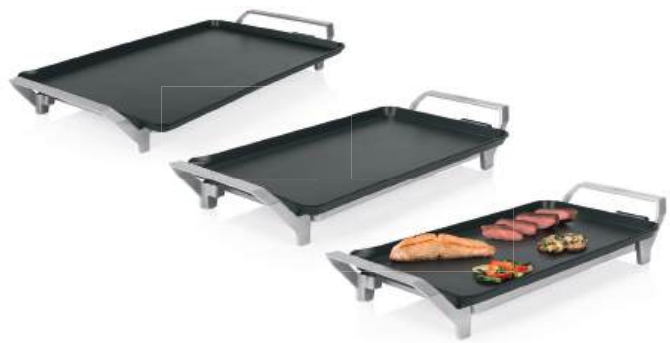
Table Chef Premium Table Chef Premium XL | Table Chef Premium XXL 01.103100.01.001 | 01.103110.01.001 | 01.103120.01.001

PARTS DESCRIPTION / ONDERDELENBESCHRIJVING / DESCRIPTION DES PIÈCES / TELEBESCHREIBUNG / DESCRIPCIÓN DE LAS PIEZAS / DESCRIÇÃO DOS COMPONENTES / DESCRIZIONE DELLE PARTI / BESKRIVNING AV DELAR / OPIS CZĘŚCI / POPIS SOUČÁSTÍ / POPIS SOUČASTÍ / ОПИСАНИЕ ЗАПЧАСТИ