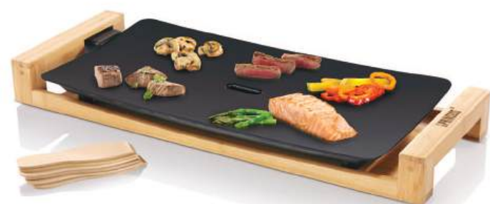
TABLE CHEF PURE Black