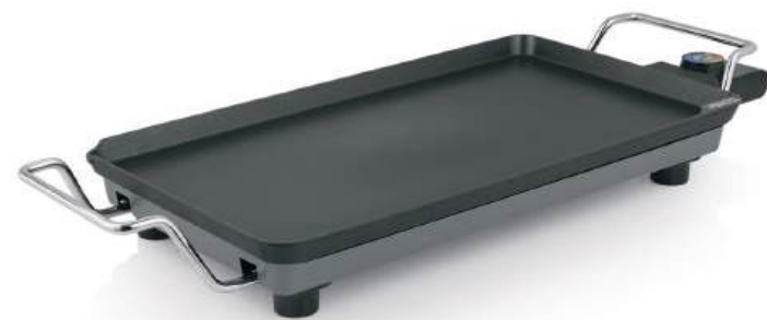
Table Chef Pro Classic 01.102300.01.005

PARTS DESCRIPTION / ONDERDELENBESCHRIJVING / DESCRIPTION DES PIÈCES / TEILEBESCHREIBUNG / DESCRIPCIÓN DE LAS PIEZAS / DESCRIÇÃO DOS COMPONENTES / DESCRIZIONE DELLE PARTI / BESKRIVNING AV DELAR / OPIS CZĘŚCI / POPIS SOUČÁSTI / POPIS SUČASTI / ОПИСАНИЕ ЗАПЧАСТИ